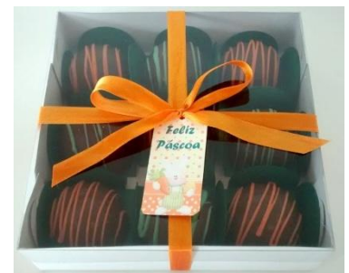
Caixa com 9 trufas de brigadeiro ou ao leite ao brancas = R$ 36,00