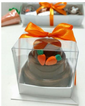
Mini bolo trufado (100g) = R$ 13,50