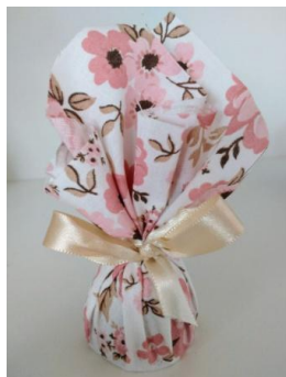
Mini trufa embalada no tecido = R$ 5,00