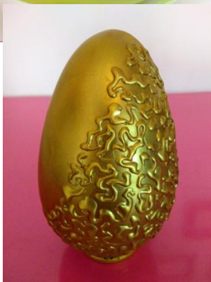
Belga trufado dourado com arabescos (500g) = R$ 135,00

** Todos embalados em caixa de acetato para presente