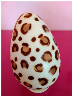
Ovo branco de oncinha com bombons sortidos (400g) = R$ 68,00