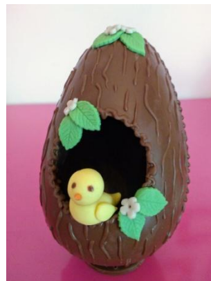
Ovo chocolate ao leite ou branco casa de passarinho (400g) = R$ 68,00