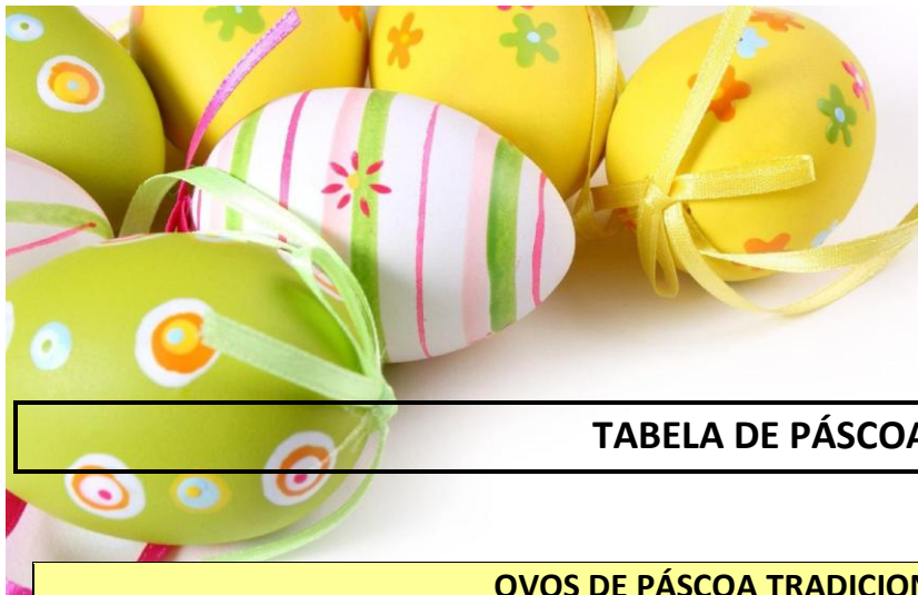
TABELA DE PÁSCOA 2019