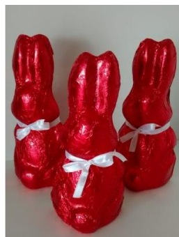
Coelho de chocolate ao leite (250g) = R$ 20,00