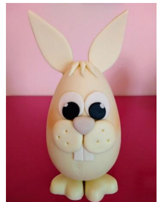
Ovo chocolate ao leite ou branco coelho (400g) = R$ 68,00