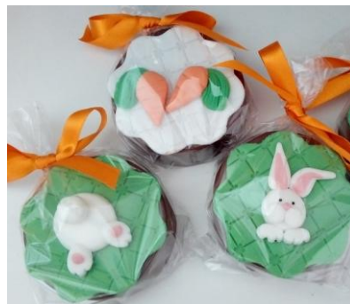
Pão de mel decorado no celofane = R$ 7,00