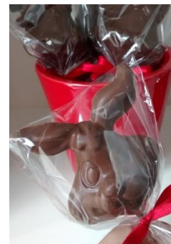
Pirulito de chocolate em formato de coelho = R$ 7,80