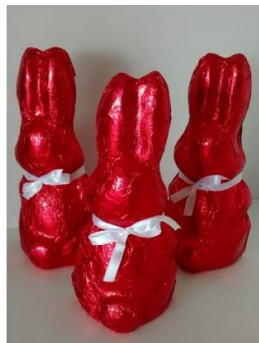
Coelho de chocolate ao leite (250g) = R$ 20,00