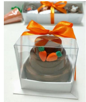
Mini bolo trufado (100g) = R$ 13,50