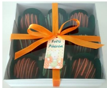
Caixa com 9 trufas de brigadeiro ou ao leite ao brancas = R$ 36,00