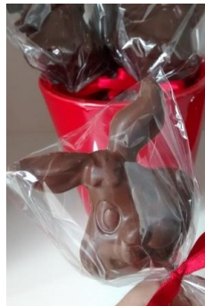
Pirulito de chocolate em formato de coelho = R$ 7,80