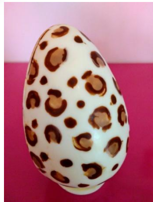
Ovo branco de oncinha com bombons sortidos (400g) = R$ 68,00